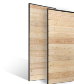
VOLETS COULISSANTS LAMES PLEINES EN BOIS EN SAVOIR PLUS