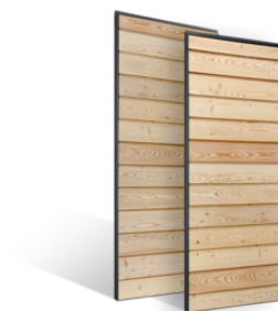
VOLETS COULISSANTS LAMES DE 114mm AJOURÉES EN BOIS EN SAVOIR PLUS