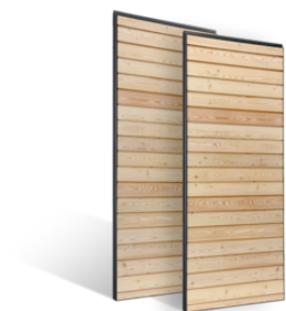
VOLETS COULISSANTS LAMES DE 58mm AJOURÉES EN BOIS EN SAVOIR PLUS